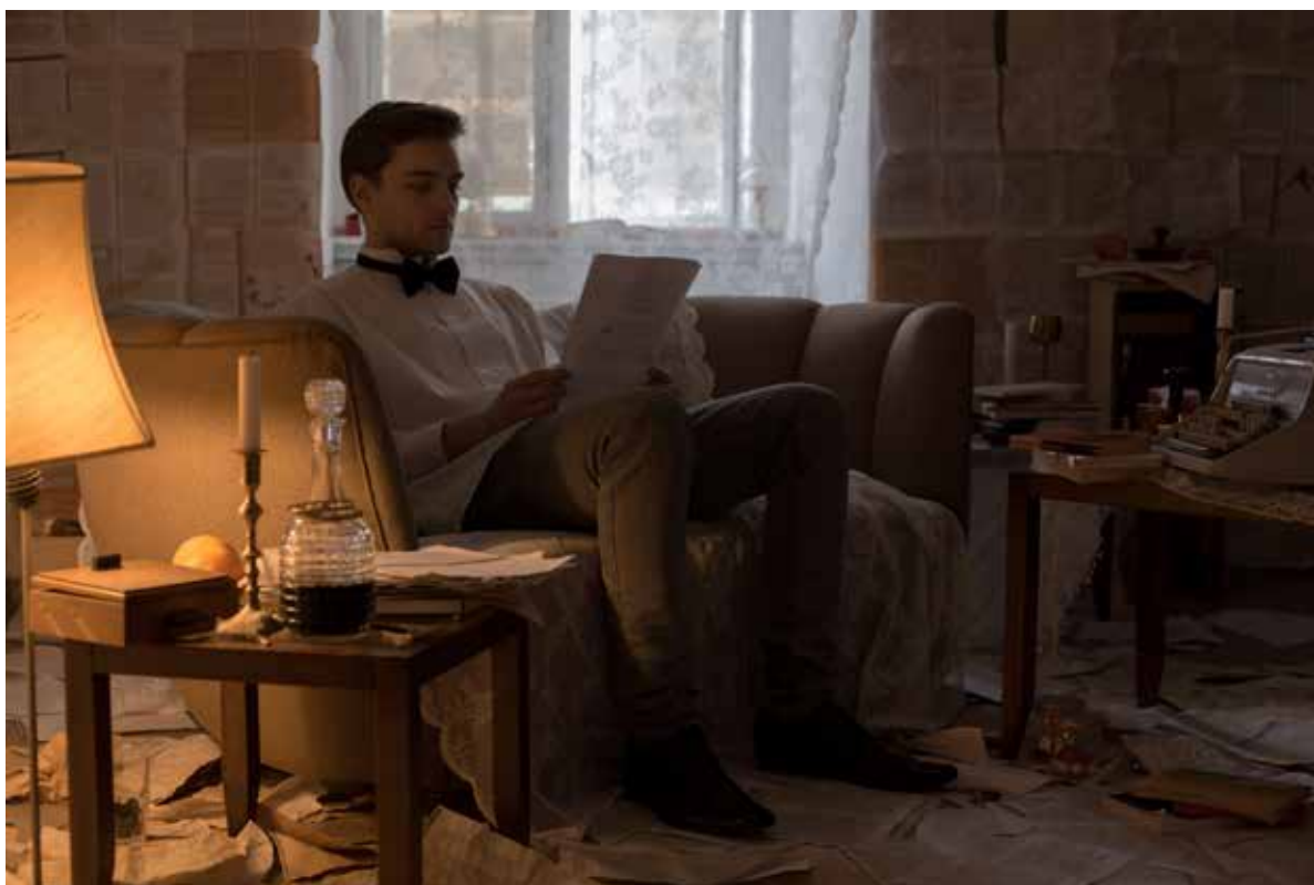
En elev laver lektier i Protector of the Archives' tableau på Sisters Academy #01.