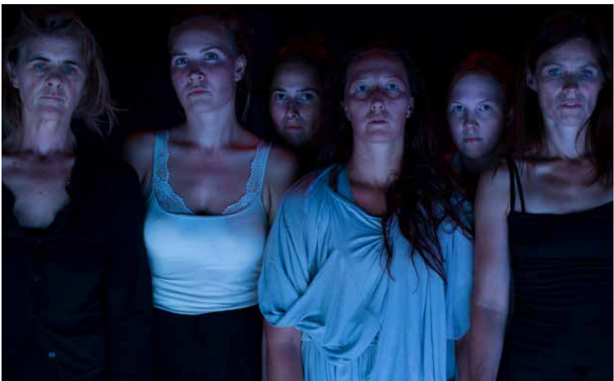
In the class of The Untamed.