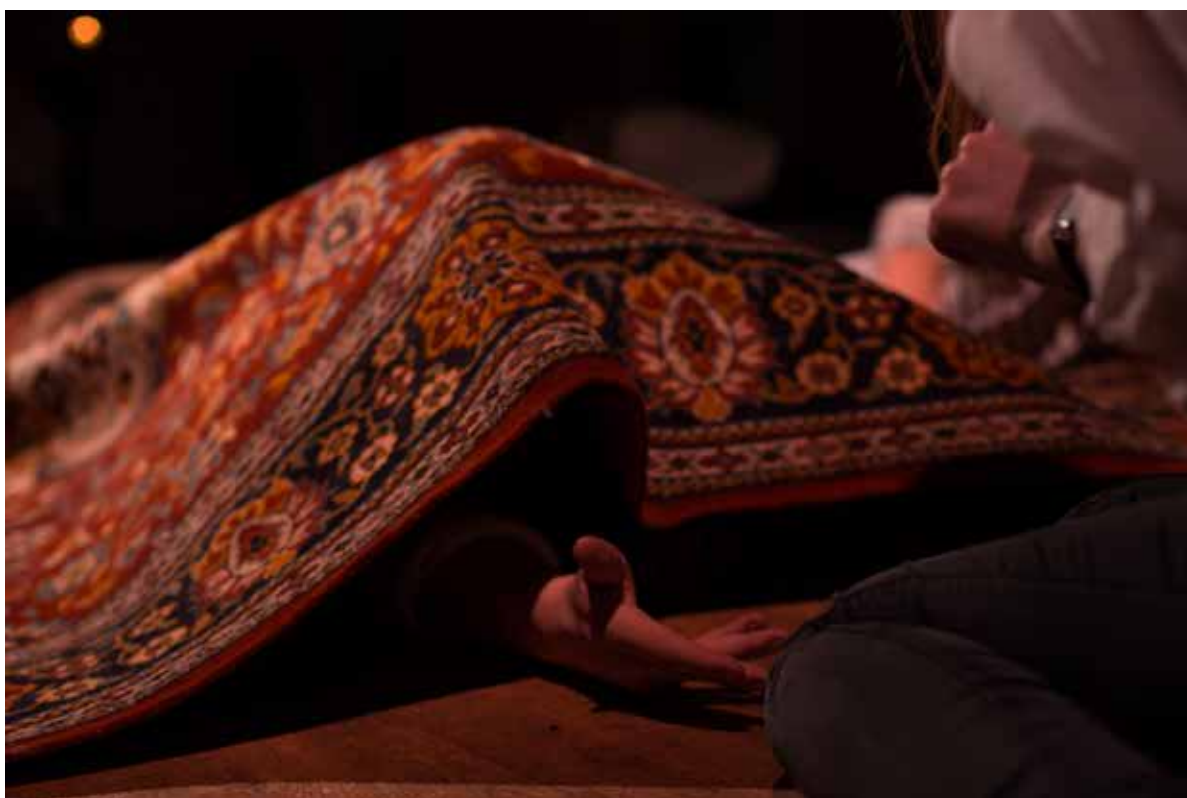
Undervisning og læring på Sisters Academy #01.