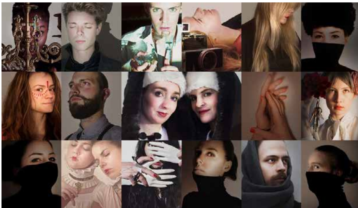
Sisters staffs' poetiske portrætter forud for Sisters Academy # 1, Denmark – The Takeover, som manifesteredes på HF og VUC FYN, FLOW.

Denne blog-post bevidner også det samarbejde, der opstod med »performance staff« (ofte blot omtalt som 'staff') under manifestationen. Som led i den omfattende scenografiske transformation af skolen flytter der en række nye kollegaer ind på skolen – »The new staff« eller »performance staff«, som de kaldes. Performererne etablerer sig rundt omkring på mulige og umulige steder på skolen, i det vi kalder »tableauer«. Her bygges et scenografisk miniunivers med udgangspunkt i performerens rolle. Dette tableau repræsenterer deres poetiske selv, og de er derfor meget forskellige i deres udtryk.