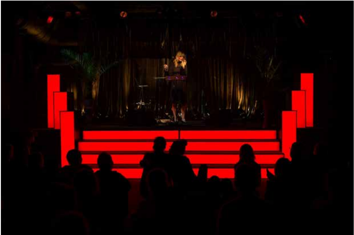
The Concert Hall.

arme og 9 ben. Helt konkret 3 kvinder der er bundet sammen. Formålet er, at få forskellige perspektiver på vurderingen af, hvilken undervisning du er parat til at foretage og deltage i hvornår.