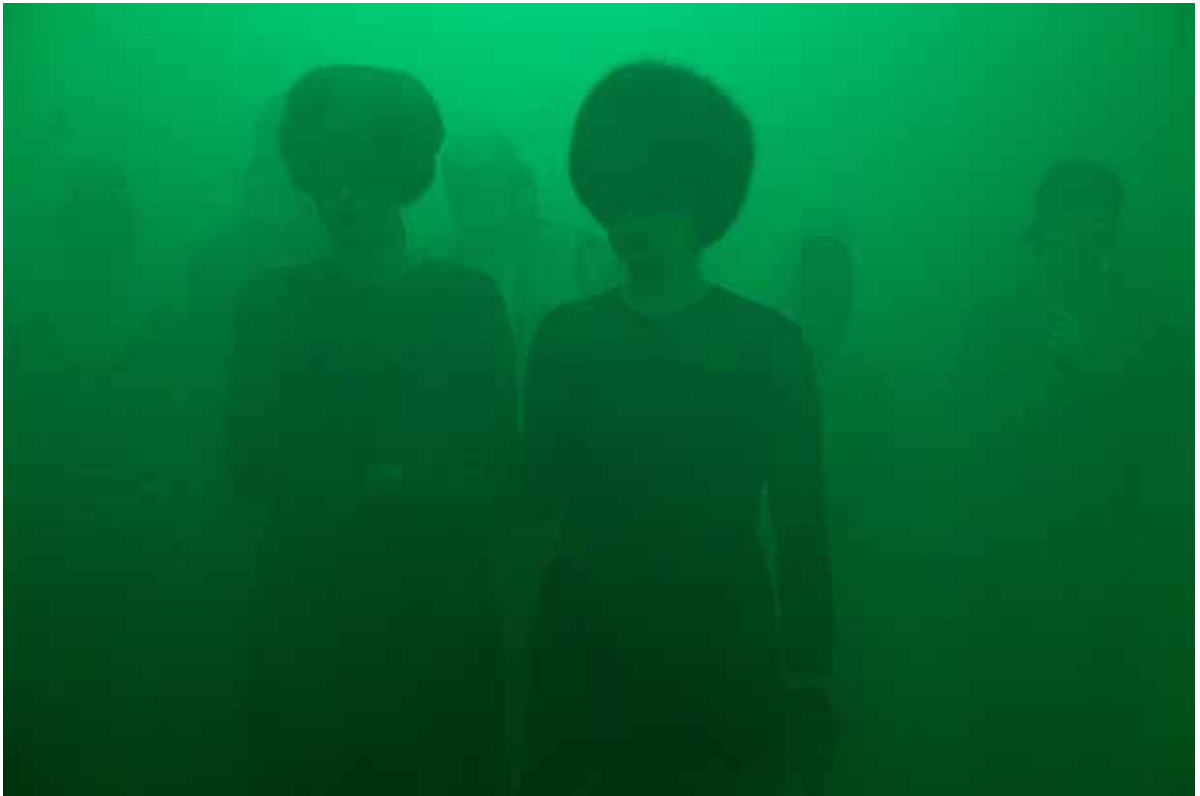
Søstrene i The Grand Hall, hvor de nye head mistresses' kontor lå i Sisters Academy #01.